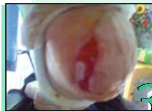
➔ Foto 3: 3 mei 2007